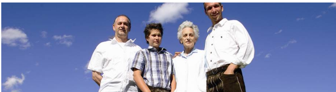
Qualität und gelebte Gastfreundschaft im Jahrhunderte alten Dorfgasthof