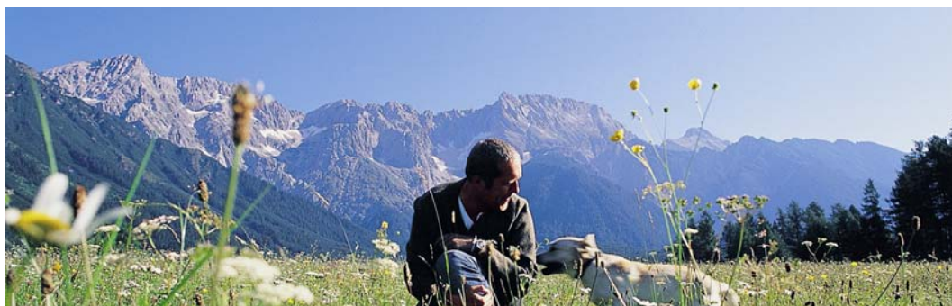
Qualität und gelebte Gastfreundschaft im Jahrhunderte alten Dorfgasthof