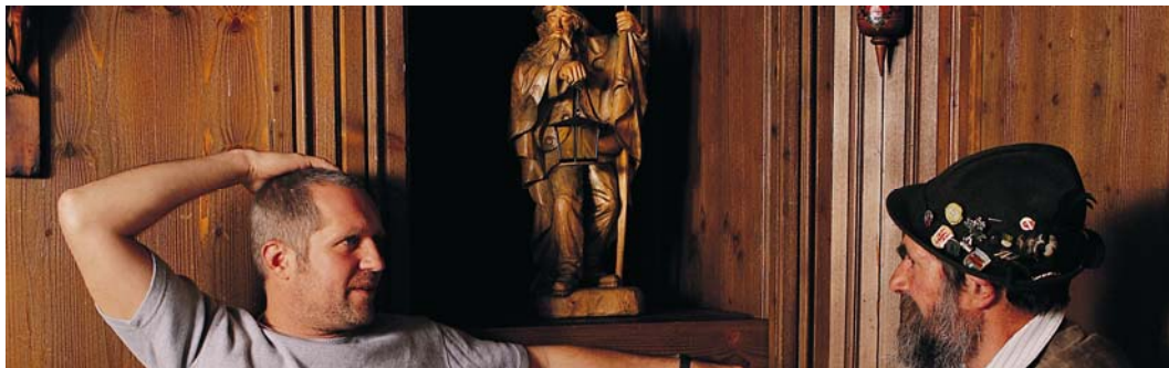
Qualität und gelebte Gastfreundschaft im Jahrhunderte alten Dorfgasthof

Die Preise beinhalten bereits alle Steuern, hinzu kommt jedoch die in Österreich vorgeschriebene Kurtaxe von € 1,60 pro Tag und Erwachsenen, die wir an den Tourismusverband weiterleiten.