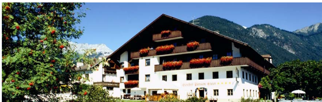
Qualität und gelebte Gastfreundschaft im Jahrhunderte alten Dorfgasthof

Als Komforthotel der gehobenen Klasse bietet der STERN heute stilvolle, geräumige und gemütliche Wohnmöglichkeiten und Platz für ca. 100 Gäste (mit Balkon). Bei der Zimmervergabe liegt es uns am Herzen auf die individuellen Bedürfnisse der Gäste einzugehen (Nähe Aufzug, 1. Stock, größeres Zimmer, Diät, ...).